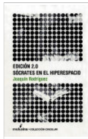
Sócrates en el hiperespacio JOAQUÍN RODRÍGUEZ Melusina. Colección Circular 16 euros

La segunda entrega de la trilogía «Edición 2.0», que se inició con «Los futuros del libro», se sirve de un diálogo de Platón, en el que Sócrates intenta convencer a Fedro de las inconveniencias de la invención y uso de la escritura, para volver a ahondar en lo mismo: las nuevas formas de transmisión y sus soportes. Oportunamente, Joaquín Rodríguez se fija en una cuestión que, con el uso de Internet, ha agudizado ese debate: el intercambio de conocimientos es muy común en chats, que son el ágora griega, y los contenidos están menos vigilados, aunque más vigilantes. Si Platón volviera, se metería de nuevo en la cueva a pensar sobre todo esto.