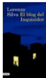
El blog del Inquisidor LORENZO SILVA Destino 18 euros